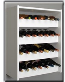
Photo of Completed Wine Rack Installation Photo de l'installation terminée du porte-bouteilles de vin

Glissez les supports du porte-bouteilles de vin sur le connecteur, tel qu'illustré. Serrez ou desserrez les vis d'un quart de tour si nécessaire. Glissez la tablette VERS LE BAS jusqu'à la butée.