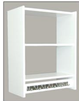
Photo of Completed Hook Panel Installation

Glissez le panneau sur les connecteurs, tel qu'illustré. Serrez ou desserrez les vis d'un quart de tour si nécessaire. Glissez le panneau VERS LE BAS jusqu'à la butée.